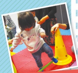
大肌肉發展~ 下肢大肌訓練 跨欄杆