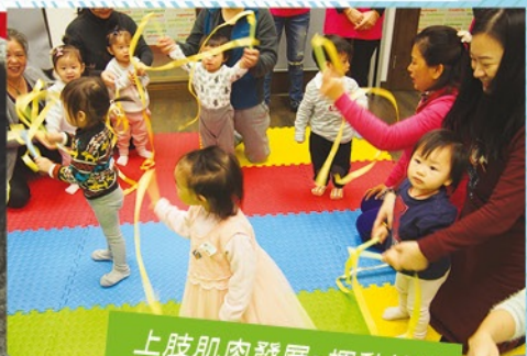
上肢肌肉發展~揮動絲帶