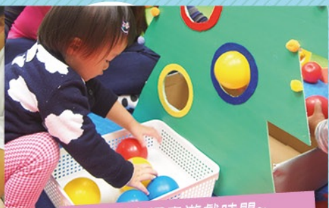
自由探索遊戲時間~ 小肌發展、認知發展