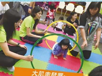
大肌肉發展~ 越過呼拉圈