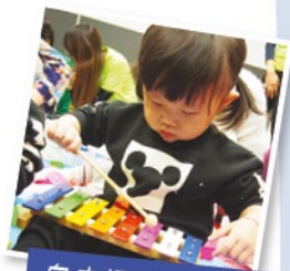
自由探索遊戲時間~ 小肌發展(協調)、 認知發展(聆聽)