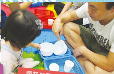
認知發展~學習配對同類物件