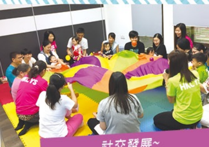
社交發展~ 學習聆聽及與同輩合作玩耍