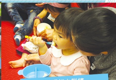
自理能力訓練~ 學習用叉叉食物進食